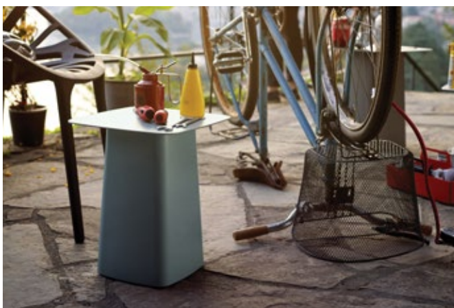
Metal Side Table (Outdoor)

In der pulverbeschichteten Variante mit Feinstruktur und in der verzinkten Version sind die Metal Side Tables wetterfeste Beistelltische, die in verschiedenen Grössen erhältlich sind.